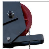
Final carrera superior Top limit switch