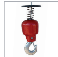
Gancho de seguridad Security hook