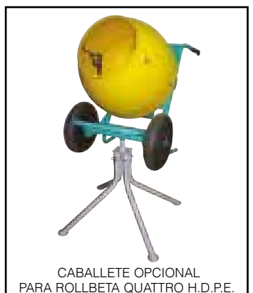
CABALLETE OPCIONAL PARA ROLLBETA QUATTRO H.D.P.E.

La basculación de la cuba es simple y segura. El caballete OPCIONAL IM2 1105490 , gracias a sus cuatro puntos de apoyo, confiere a la ROLLBETA QUATTRO H.D.P.E. la máxima estabilidad.